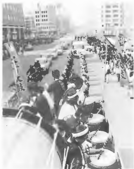
第1回ほっかいどう祭り

〔観光案内所業務〕◇東京・大阪 旅行業者、報道機関、職場、学校などに観光情報、資料の提供と観光映画フィルム、写真、パネル、ポスターなどの貸出しを行ったほか、旅行業者との懇談会、北海道友の会修学旅行誘致懇談会、スズランナイター、北海道の観光