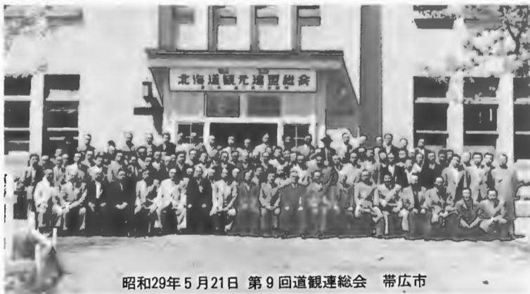
昭和29年5月21日 第9回道観連総会 帯広市