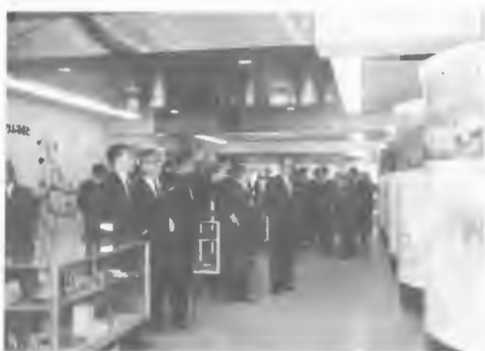
オープンした観光コーナー

〔商工観光センター開設〕○道経済センター1階に、道により北海道商工観光センターが開設（11月）され、道観連は観光コーナー部門を管理する。