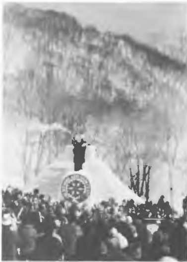
第1回北海道雪の祭典

○冬の美しさ楽しさを道内外に紹介し、冬季レク活動を積極的に進め健康で明るい道民生活の向上を図るため、3/13~14ニセコアンヌプリ国際スキー場、太平洋クラブニセコモイワスキー場を主会場に「第1回北海道雪の祭典」を開催、聖火パレード、SAJ公認バッジテスト、プロスキーヤーショー、雪だるまコンクール、タイマツショー、雪の女王撮影会花火大会などで、2万5,000人の観客を動員した。○関係団体と共催で、スキー・白鳥・丹頂鶴・流水・冬まつりを主体に11月から3月にかけて「冬こそ北海道」のキャンペーンを実施。○冬季観光行事育成のため、雪まつり氷まつりなど29行事に助成を行った。