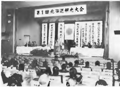
第1回北海道観光大会

の参加を得て開催、観光政策予算の大巾増額など7項目を決議した。○観光大会決議事項並びに千歳空港の工事に伴う滑走路使用制限有珠山災害金融と復旧対策などについて関係先に陳情、要請を行った。