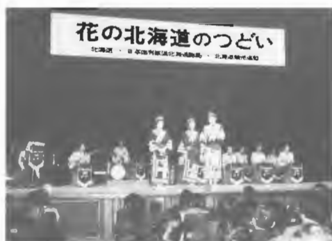
東京と大阪で花の北海道のつどい

冬」を開催。10/29秋田市木内百貨店を皮切りに道外の主要都市13会場（後援21会場）で「北海道の物産と観光展」共催。札幌オリンピック冬季大会と冬季の観光客誘致のため、10/29～11/10東京西武、12/7～12札幌三越で「札幌オリンピックと冬のレジャー展」開催。国鉄、日本観光協会の共催で11/8～13東京駅、11/15～28新宿駅で催された全国スキーとスケート冬の旅展に協賛。○冬季観光客の誘致をはかり全日空と共催で、東京都内の報道関係18名を本道に招き、1/18～20主要スキー場、オリンピック施設を視察、終了後札幌で懇談会を開く。○春季の観光客誘致のため国鉄、日観協支部と共催で、3/25～30東京と大阪で花の北海道のキャンペーン実施。○主要観光地の協力を得て、3/2～31関東地区（NTV）を対象にテレビスポットを放映。