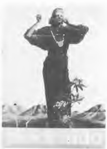
ポスター「摩周湖とメノコ」