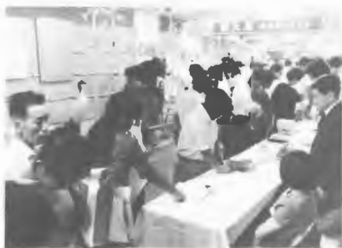
観光展「北海道の秋と冬」

東京西武，8/19～23大阪高島屋，9/4～9名古屋名鉄，11/6～15千葉奈良屋，11/10～15東京高島屋で，観光展「北海道の秋と冬」開催。12/8～13札幌丸井百貨店で「札幌オリンピックと冬のレジャー展」開催。5/30北海道神宮で観光祈願祭と郷土芸能奉納，翌31日は大通公園で道内の代表的郷土芸能を披露した，第2回「花の北海道まつり」を開催。ことし参加した郷土芸能は松前の杵振舞，江差の餅つきばやし，積丹のソーラン節踊り，登別の北海太鼓，白老のイオマンテ，定山溪のかっぱ踊り，層雲峡の峡谷火まつり音頭，白糠の駒踊り，音別のフキまつり音頭，釧路の蝦夷太鼓，網走のオロチョンの火まつり，の11団体。10/30秋田市木内百貨店はじめ道外の主要都市28会場で「北海道の物産と観光展」共催。道，国鉄と共催で花の北海道キャンペーンの関連事業として，3/27東京都の共立講堂で恵山太鼓，白老のイオマンテなどが出演して「観光大会・花の北海道の集い」を開催。