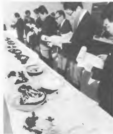
新しい郷土料理の発表会

〔郷土料理の開発〕○道全調理師会の協力を得て郷土料理の創作研究を行い、2/18道自治会館で創作発表会（45品目）と審査会を開催、さらに優秀推せん料理20品目について3/12道厚生年金会館で試食会を行った。また新聞、テレビによる調理紹介や、料理メモを作成して関係先に配布した。