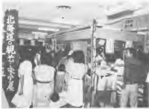
北海道の観光と味覚展

○「冬こそ北海道」のキャンペーン 冬季観光振興のためキャンペーンを実施、ポスターB全判4種類4万3千枚、パンフレット5万部作成したほか、11/21~30新宿駅で開かれた「冬の旅展」、11/22~24晴海国際見本市会場で催された「全国農林水産まつり」に参加、また、次の日程で各地区のレジャー記者を招くなどして、冬の北海道を売り込んだ。