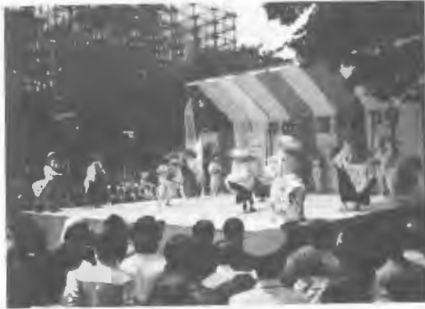
第1回花の北海道まつり

した郷土芸能は松前の松前神楽、江差の餅つきばやし、積丹の正調鯉場音頭、登別の北海太鼓、札幌のすすきの音頭と定山溪かっぱ踊り、旭川のイオマンテ、白糠の駒踊り、音別のフキまつり音頭、釧路の蝦夷太鼓、網走のオロチヨンの火まつり、の11団体。