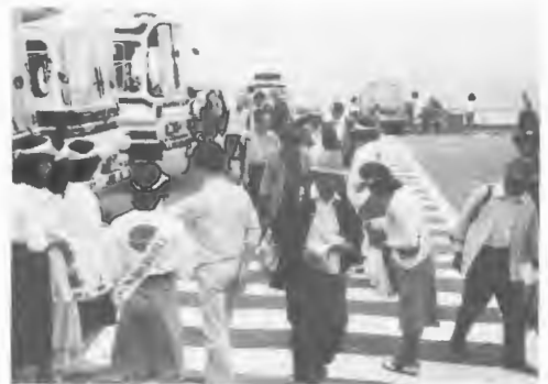
美化キャンペーン

光旅館の経営者及び管理職を対象に観光旅館経営者セミナーを開催。○受入体制推進活動の一環として、①接客従業員の質的向上を図るため、地元関係団体の協賛を得て24地区で接客改善研修会を開催。受講者1,115名。②観光地の環境整備のため、くずかご140個、ごみ袋4万5,000を配布したほか、日観協道支部などと共催で7/20函館山、7/22羊ヶ丘展望台で美化キャンペーン実施。