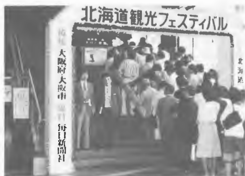
大阪で観光フェスティバル

○大阪で観光フェスティバル 関西地区の北海道志向を高めるため, 5/12大阪の毎日ホールで「北海道観光フェスティバル」を開催, 観光映画の上映, 郷土芸能, 本道出身タレントの公演, 観光資料の展示など多彩な催しがくり広げられ, 3,500人の観客で埋まった毎日ホールは北海道一色のムードに包まれ