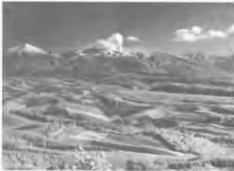
観光写真コンテスト入選作品

〔宣伝誘致〕○英文フォルダー「HOKKAIDO, リーフレット北海道(2種類)作成。○国鉄道支社、毎日新聞社と共催で第4回観光写真コンテスト実施。○日本経済新聞社と共催、東