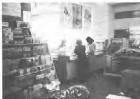
東京案内所はこの年に開設された