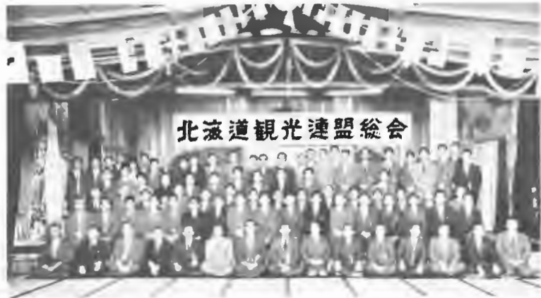
社団法人となって初の総会（函館） 38・5・24

た日本観光協会道支部総会，3/4札幌で開かれた同支部臨時総会に出席。○3/27東京で開かれた社団法人日本観光協会創立総会に出席。