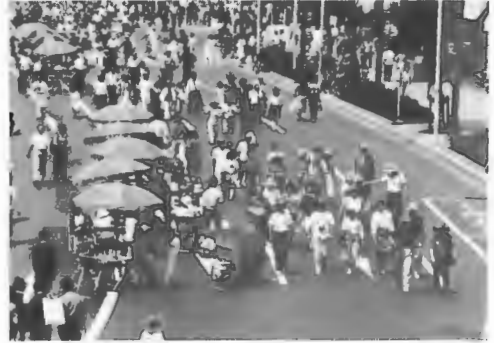
ランラン・スズラン・イン銀座

〔一般事業〕○北海道観光フェスティバル実行委員会の事務局として、特別キャンペーンと連動し、5/15大通公園西8丁目からスタートしたスズラン鳩レースを第1弾に、東京都で次の催しを実施した。6/6NHKホールで名曲コンサート「ほっかいどう」、6/7上野公園～銀座8丁目までランランスズランイン銀座、6/6後楽園スタジアムでスズランナイター、6/4～9大丸東京店で北海道の観光と味覚展、5/15～6/13都内郷土料理店で観光と味覚まつり。その他5/11～17銀座ソニービルで開かれた「さくら草、フェア」、6/21読売ランドで催された熱気球を見る会の2行事に協賛。