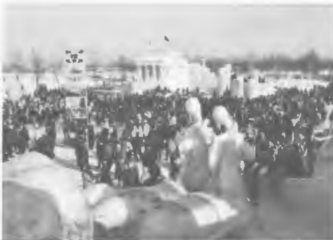
各地の冬まつりに助成

〔観光案内所業務〕○旅行業者、報道機関、職場、学校などに資料の提供と、諸行催事にパネル、ポスター、映画フィルムの貸出しを行ったほか、「全国郷土の観光と物産展」「北海道の産業と観光の会」「さっぽろ・サッポロまつり」「北海道ナイター」「北海道観光ポスター展」「白い北海道展」「周遊券展」「北海道の物産と観光展」など各種行事に協力した。