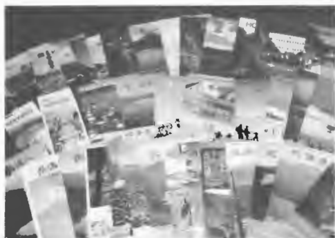
作成されたパンフレット類

〔宣伝活動の推進〕○本道観光の総合的PRのため、道の助成を受け広域観光宣伝印刷物を作成することになり、各地との協賛事業を含め次の印刷物を作成した。チラシ「北海