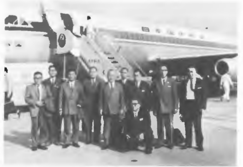
九州へ誘致調査団派遣