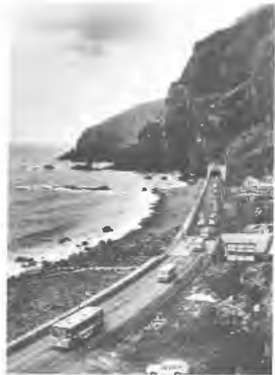
11月に待望の茂津多岬開通

○観光地の美化のため日観協道支部などと共催で、7/25川湯温泉の硫黄山において観光地美化キャンペーンを実施したほか、7月に主要海水浴場にゴミ袋5万袋配布した。○“観光客を親切に迎える運動”として、モデルワッペンを作成配布と、親切運動標語募集を行い関係団体に運動の推進を呼びかけた。