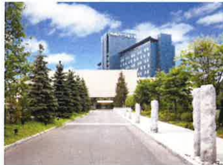
○会場 (パークホテル) 外観

■ JR札幌駅から地下鉄南北線(真駒内行き) 「中島公園」駅下車 3番出口から徒歩約1分