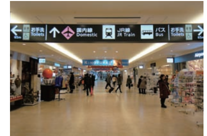
3 국내선 여객터미널 도착 후에는 상점가를 따라 직진합니다.