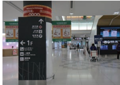
1 국제선 여객터미널 2층 도착로비 부터 출발합니다.

신치토세공항 국제선터미널에서 삿포로시내까지 열차를 이용하시면 매우 편리합니다. 신치토세공항~삿포로역 사이에 쾌속 AIRPORT가 15분 간격으로 운행되고 있으며, 소요시간은 약 36분입니다. 국제선터미널에서 JR신치토세공항역까지 가시는 길은 아래를 참고하여 주시기 바랍니다.