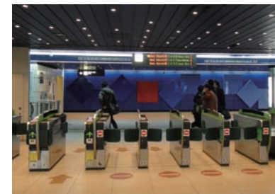
8 승차장은 JR신치토세공항역 지하 2층에 위치하고 있습니다.