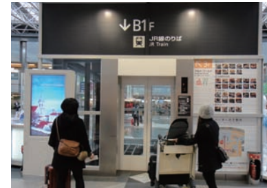
5 엘리베이터를 타고 지하 1층으로 내려갑니다.