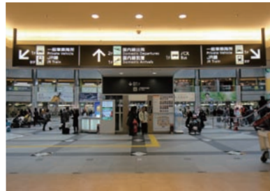
4 상점가를 지나면 국내선 여객터미널 엘리베이터가 있습니다.