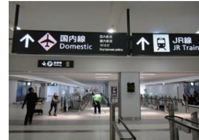
2 국내선 여객터미널까지 약 240m 길이의 연결통로를 따라 이동합니다.