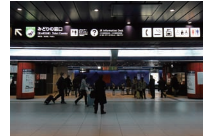
6 지하 1층 엘리베이터 왼쪽으로 JR인포메이션 데스크가 위치하고 있습니다.