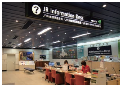
7 JR인포메이션 데스크에서는 레일패스를 교환하거나, JR 승차권을 구입할 수 있습니다.