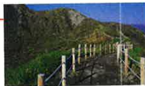
■有珠山外圍登山步道 1977年噴發以來,27年來首次解禁地區。 欣賞溶岩谷、火山口的同時,眼下伸展 開來的噴火灣和遠處的羊蹄山美景也 一覽無遺。