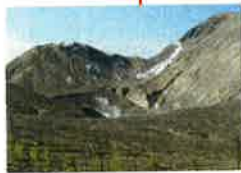
■銀沼大火口 1977年山頂噴發時形成的 最大火山口