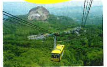
■有珠山纜車 可乘106人的大型纜車。 在您還陶醉于眼下的昭和新山美景時, 纜車已在6分鐘內走完1370米的空中距離。