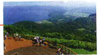
■洞爺湖觀景台 山頂站的左手邊。洞爺湖,昭和新山 美景盡收眼底,是絕好的取景地點。