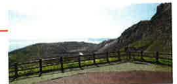
■有珠山火山口原觀景台 從山頂站向左走7分鐘就到。 銀沼大火口和噴火灣的絕色美景盡現眼前。