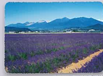
동쪽에는 도카치다케 연봉