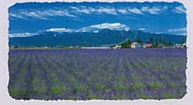
남쪽에는 유바리 산지